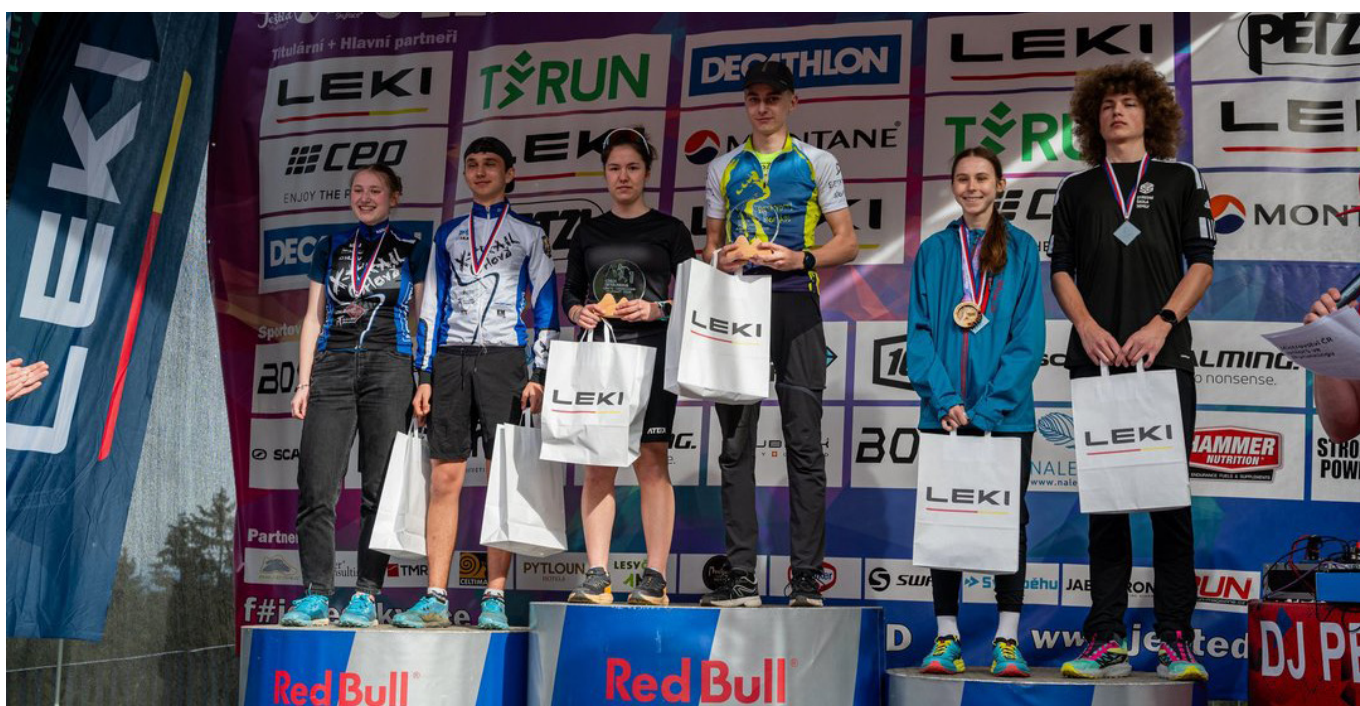
Vyhlášení juniorské kategorie